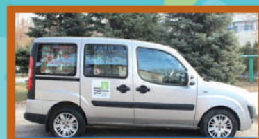
Социальное такси 48-31-77